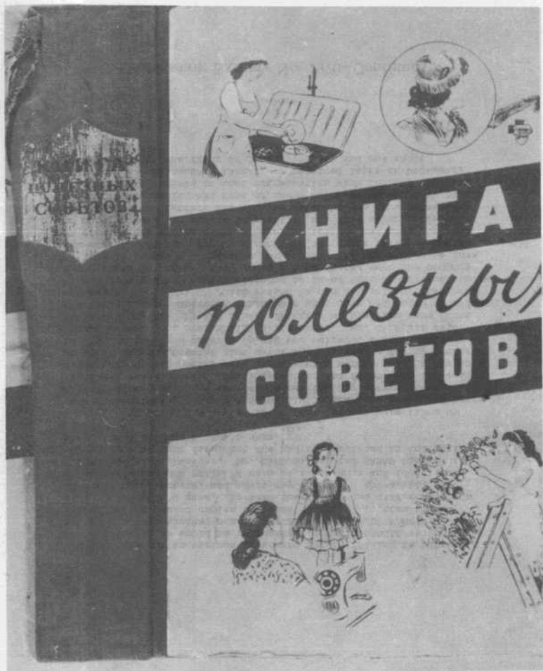
COMMISSION EXHIBIT No. 1971—Continued